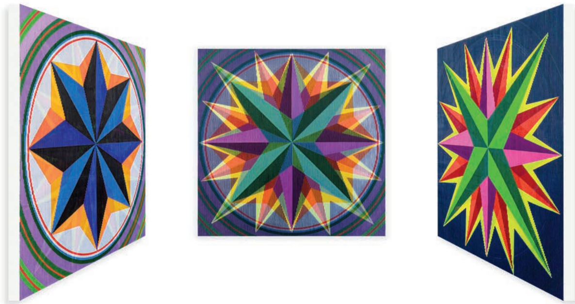
MARCO POLO AUF DER SUCHE NACH GUCCI GUCCI 120 x 120 CM