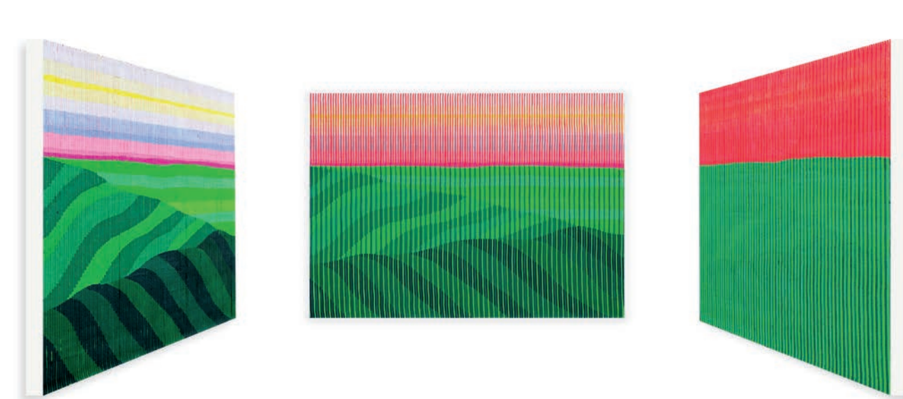
DIE WIRKLICHKEIT DES STILLEBENS 50 x 70 CM